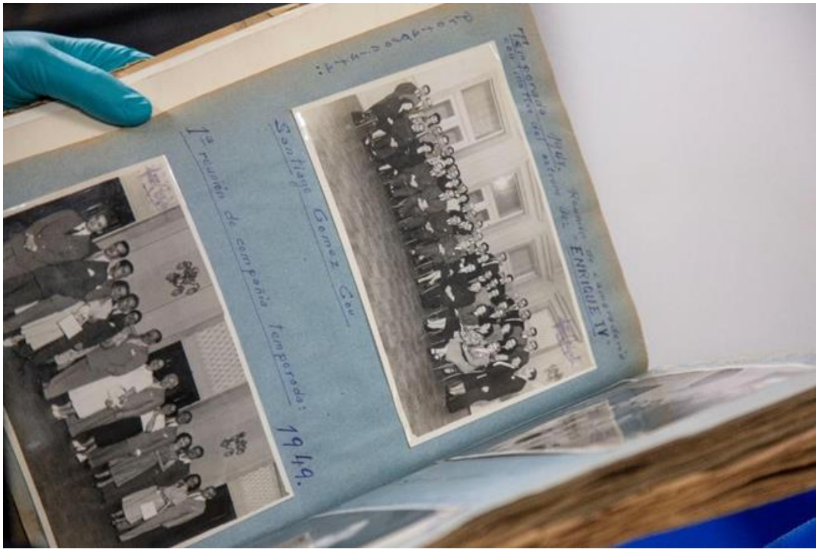
Fotografía en papel/ Documentos soporte papel